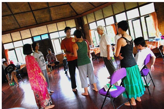
Une séance de « constellation familiale »